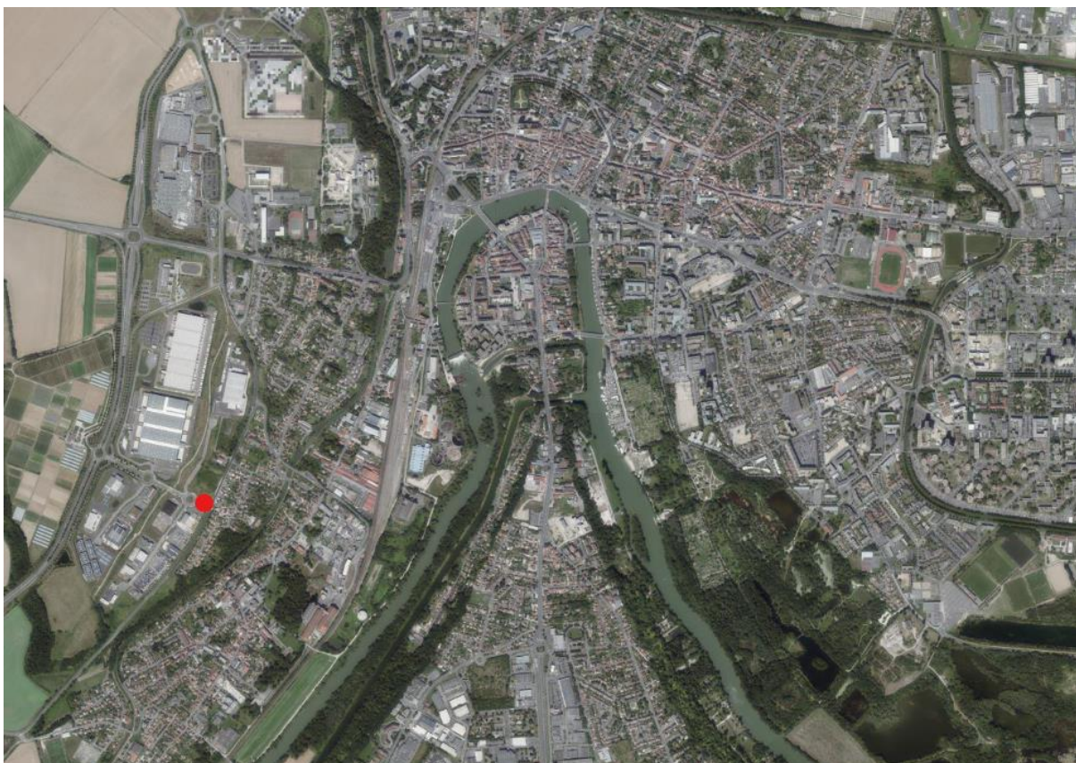
Situation de l'emprise