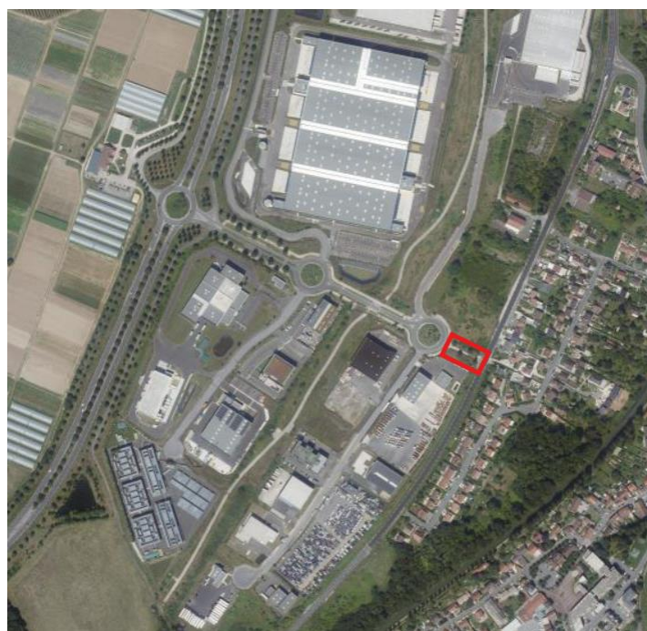
Localisation de l'emprise mise à enquête publique pour déclassement (vue aérienne)