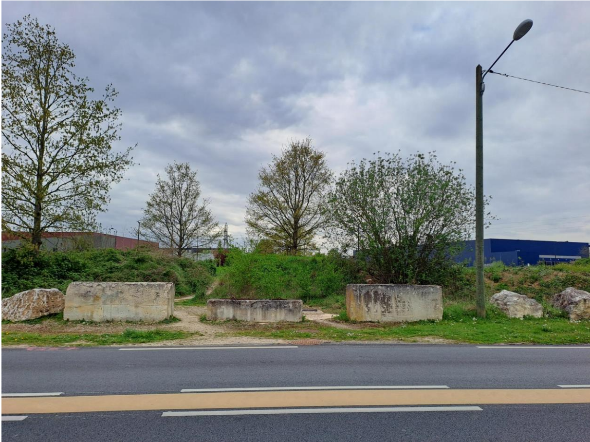
Photo de l'emprise mise à enquête publique pour déclassement (vue de la rue du Pré Tillet, RD5 hors PAPM)