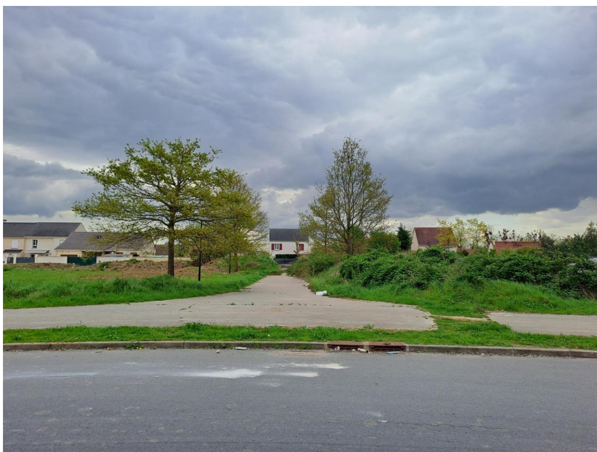
Photo de l'emprise mise à enquête publique pour déclassement (vue du rond-point du PAPM)